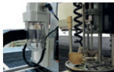
Sistema de enfriamiento o de lubricación de la cuchilla según los tejidos.